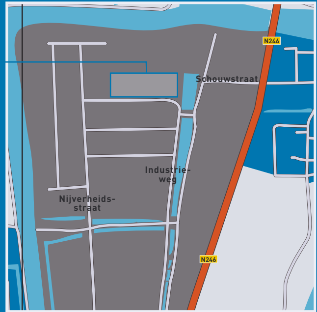
INDUSTRIEWEG 62 T/M 124